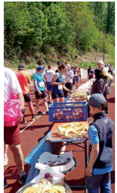
Alles gerichtet. Dies alles und noch viel mehr wartete auf die Finisher.

Bezüglich der weiteren Laufergebnisse wird hier nur auf die Berichte in der örtlichen Presse verwiesen und auf die Homepage www.genusslaeufer.de , wo alle Ergebnisse, Berichte und Bilder abgerufen werden können. Am Ende noch die alte Weisheit „Nach dem Lauf ist vor dem Lauf“, in diesem Fall dem 21. Genusslauf Ende April 2023, zu dem die Vorbereitungen dank der tollen Rückmeldungen der Teilnehmer schon in Bälde anlaufen werden.