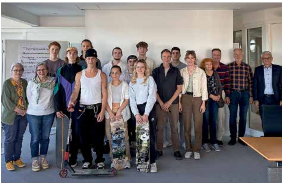
Nach langer Pause trafen Jugendliche, Stadträte und Vertreter der Stadtverwaltung beim Jugendforum aufeinander.

Der Stadtjugendreferent zieht ein positives Fazit: „Die Stadträte haben auf den Verlauf und auf die Themen positiv reagiert. Es waren konstruktive Gespräche in einer angenehmen Atmosphäre.“ Nun gilt es, die Themen möglichst zeitnah in den Gemeinderat zu tragen und entsprechende Ziele zu vereinbaren.